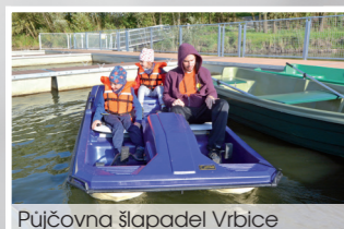
Půjčovna šlapadel Vrbice