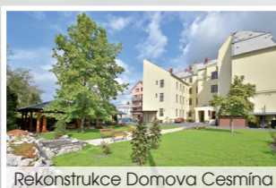
Rekonstrukce Domova Cesmína